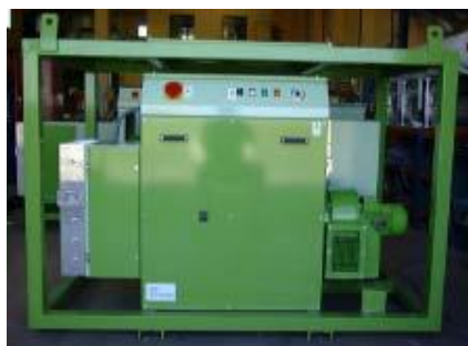
OVERALL DIMENSIONS :